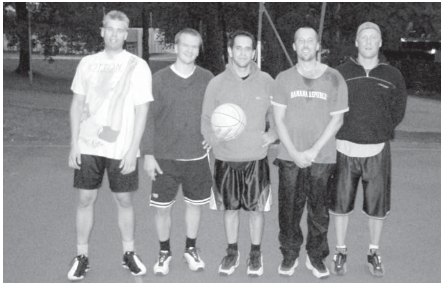
Syksyisen illan viimeiset harjoittelijat.

Tälläkin hetkellä Poliisikouluun voidaan mielestämme ainakin vallitsevan lainsäädännön perusteella ottaa myös siviilipalvelusmiehiä. Itse asiassa tätä kirjoitusta laatineessa ryhmässäkin on yksi ”sivari”!