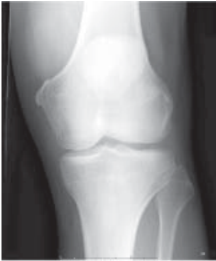
Polven röntgenkuva edestä

Akuutit polvivammat voidaan jakaa karkeasti murtumiin ja pehmytkudosvammoihiin. Pehmytkudosten eriaisteiset vammat ovat huomattavasti murtumia yleisempiä.