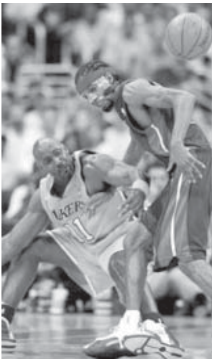
Karl Malone loukkasi polvensa NBA:n finaalisarjan neljännessä ottelussa viime kaudella ja Lakers joutui tulemaan toimeen ilman häntä jatkossa ja hävisi finaalisarjan.

Polven alueen luut ovat urheilijoilla yleensä varsin hyvässä kunnossa ja tarvitaan varsin suurenerginen vamma aiheuttamaan luunmurtuma. Poikkeuksena mainittakoon polvilumpion murtuma, johon vaadittava suora iskuenergia ei välttämät-