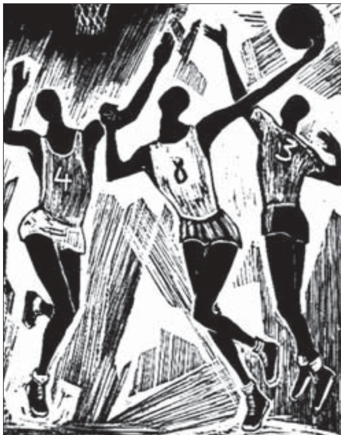
Tuulikki Pietilä -59