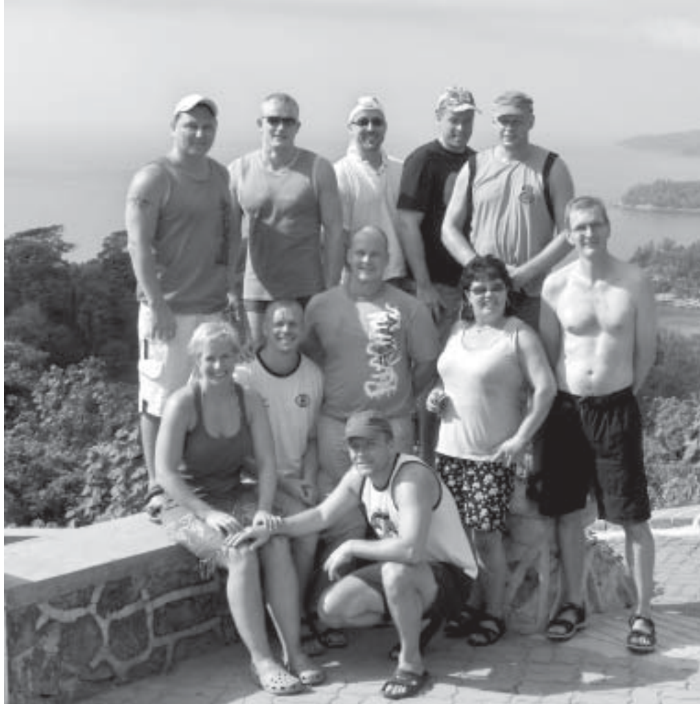
Päiväretkellä. Taustalla Kata Beach ja Karon Beach

Thairuoka ei sen sijaan ollut niin erilainen elämys kuin ilmankosteus. Vaikka ruoka oli erinomaista lähes jokaisessa valitussa ravintolassa, uskallan väittää, ettei maku verrattuna Suomen parhaiden thairavintoloiden ruokiin poikennut kovinkaan paljoa. Se, mikä poikkesi, oli ruoan hinta. Matkamme aikana valuuttakurssit olivat sitä luokkaa, että n. 2,2 eurolla sai 100 bathia. Eli jos esim. paistettu riisi kanalla maksoi 50 bathia